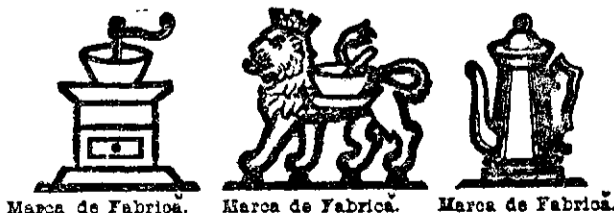
Marca de Fabrică. Marca de Fabrică. Marca de Fabrică.

Heinrich Franck & Söhne Linz. Ludwigsburg.