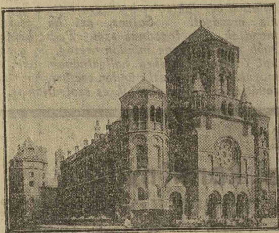
A lerombolásra ítélt müncheni zsinagóga

Münchenben 1925-ben 10.000 zsidó élt. Ma már legfeljebb 6000. Kimutathatóan tör-