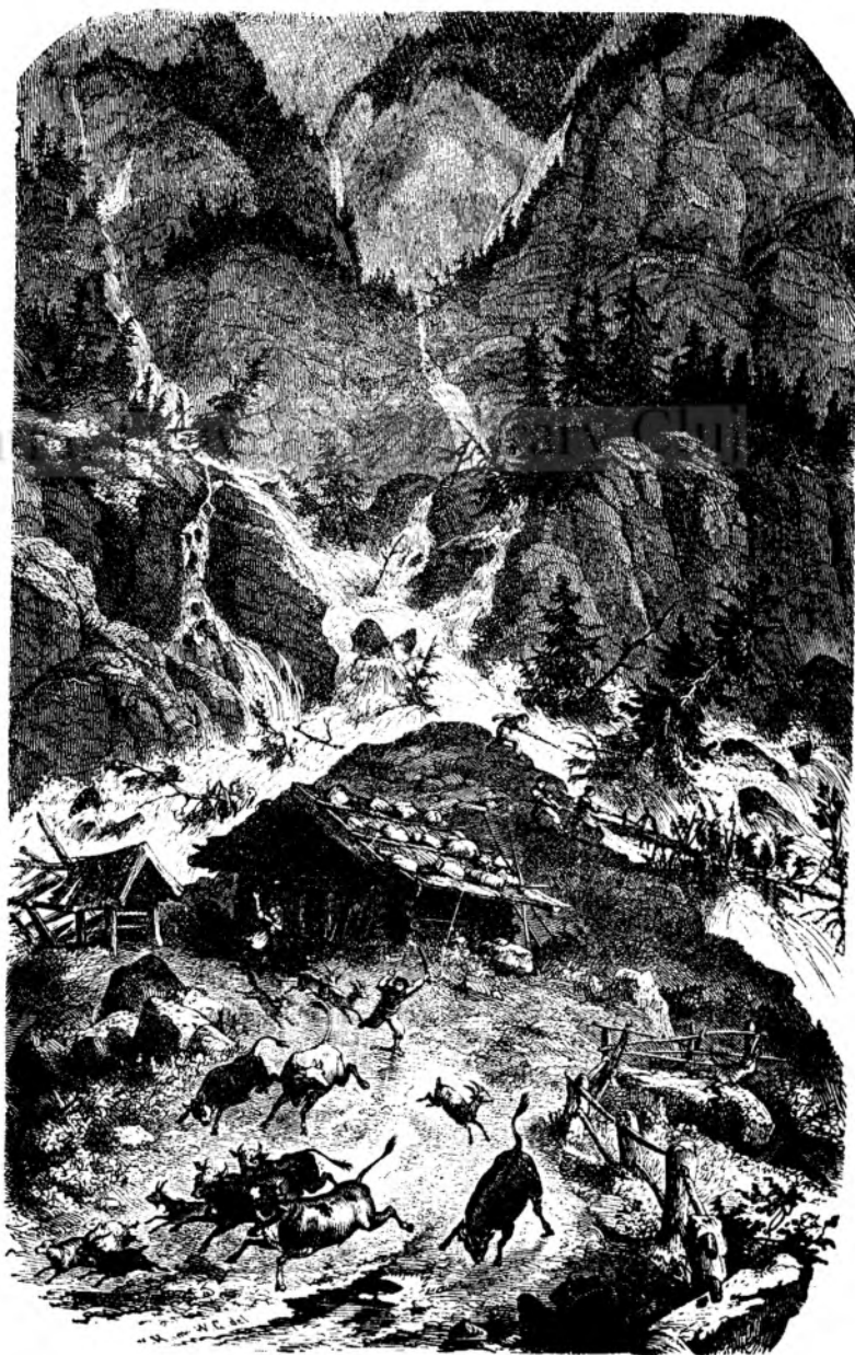
Viscolu în Carpati.

Dimbovitianu : Imi pare bine, caci ieta vreu se petrecu la tine vr'o ora doue. Vom juca o partia de... ce vrei.