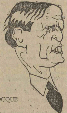
DE LA ROCQUE

Közben azonban Napoleonnak megváltozott a zsidókérdést illetőleg a nézete. Ennek