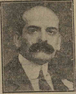
FELIX M. WARBURG

csen az ötmillió amerikai zsidóságnak olyan... de a többmillió lengyel zsidóságnak sem, mondaná el a „boruch dajon emet”-et, amely haláleset hallatára kell elmondani minden... Aki pedig már olyan messzire esett a lényegétől, hogy ezt nem tudja, az a saját nyelvén kell elmondja: legyen emléke áldott. ... legyen emléke áldott annak a Félix M. Warburgnak, aki hirtelen elhunyt New-Yorkban 67 évében és világraszóló típusa volt annak a hirtelen áldástó zsidó filantrópnek, akiből minden napról-napra kevesebb lesz. A lengyel zsidókban siratják, mert tengernyi könnyet száritott