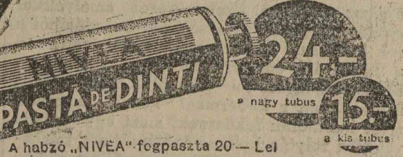
A habzó „NIVEA”-fogpaszta 20— Lei

most habzó „NIVEA”-fogpasztát is kaphatunk. Most választhatunk: habzót vagy nem-habzót vegyünk, bármelyiket megkaphatjuk.