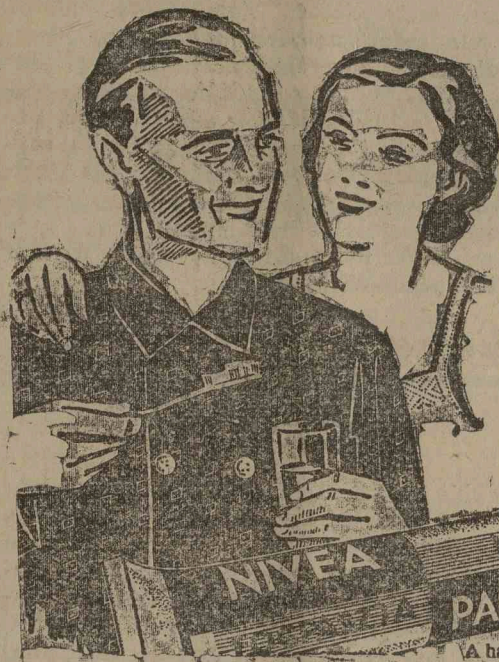
A habzó „NIVEA”-fogpaszta 20 = Lei

Ami pedig a másik rágalmat illeti, az is éppen ennyire gonosz. Hogy mi itt az országban 864.000-en vagyunk, ezt még a Goga-féle népszámlálás állapította meg. Ezt igazolja