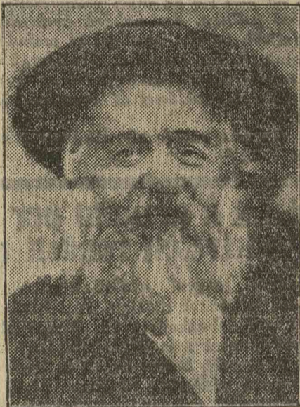
SPIRA LÁZÁR z. c.

A zsidóság egyik legmagasztosabb és legszebb ünnepének, a Sevuotnak beköszöntése előtt a modern hirszolgálatot végző technikai alkotások pillanatok alatt röpittek világgá a hírt Kárpátalja híres-nevezetes városából: Munkácsról, amelyben lakonikus rövidséggel közölték, hogy: Spira Lázár, a munkácsi rebbe elköltözött az élők sorából. A „Népünk” ünnepi száma már készen volt így csak röviden közölhetjük a halálesetet, le az elhunyt főrabbi olyan markáns egyéni-