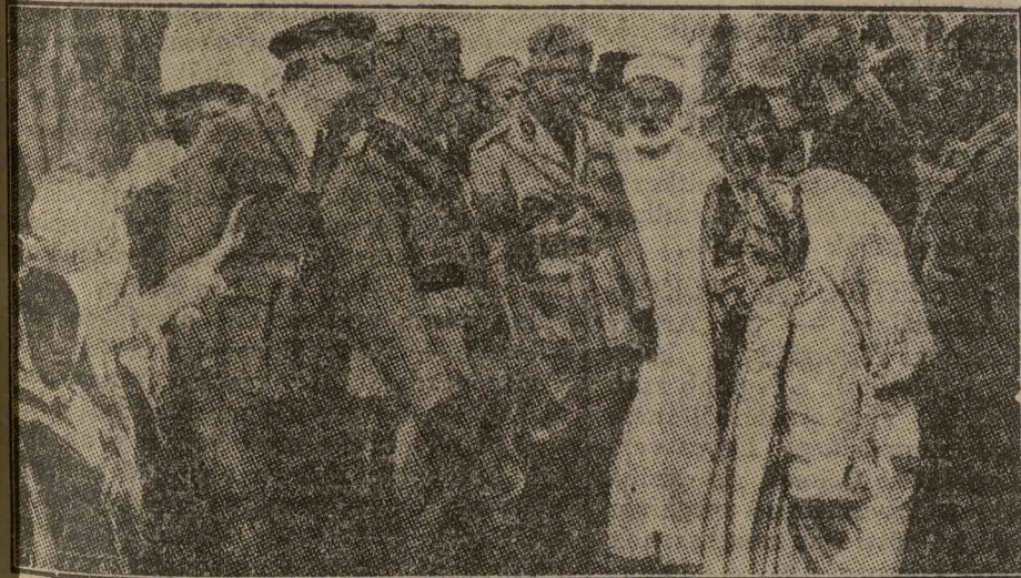
Mussolini beérkezése a tripoliszi zsidó gyerekekkel. Mögötte Balbo kormányzó, előtte a tripoliszi főrabbi.