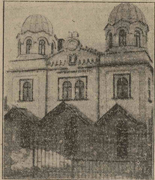
A bucuresti spanyol KAL KADOSCH GADOL nagy zsinagóga

A bucuresti szefárd zsidóságnak tulajdonképpen két nagy zsinagógája van. A Kal (Khal) Kados Gadol templom, ez a 2000 hívő befogadására épült nagy zsinagóga, amely 140 évvel ezelőtt lett reno-