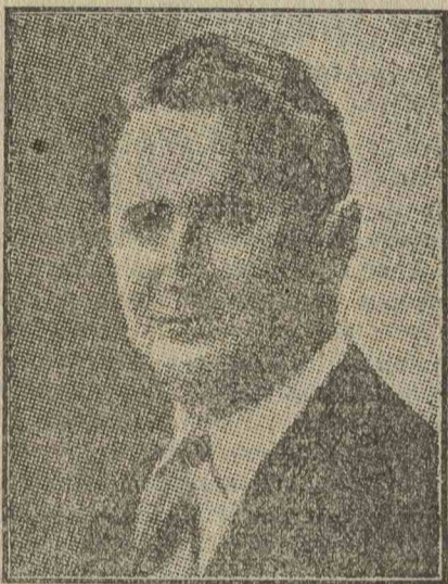
Dr. Nahum Goldman

Oradea. Éjfél volt, amikor elhagytuk a bankett színhelyét, amelyen lenyűgözött hallgatóságot korunk egyik legnagyobb zsidó politikusának Nahum Goldman dr. nak beszéde