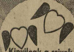
Kinyílnak a szívek