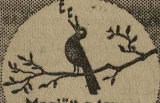
Megjött a tavasz

Most igazán NIVEA-val a levegőre és napra.