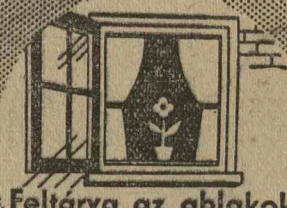
Feltárva az ablakok