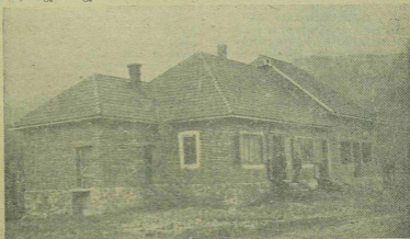
Az épülő gyarkiskapusi „Magyar Ház”. Az új épületben nyert elhelyezést az Enke, a Hangya Szövetkezet, a Hitelszövetkezet és az Enke Gazdakör.