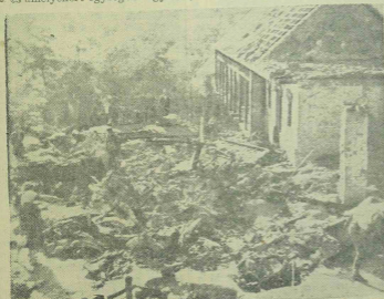
Egy kis budapesti családi ház, amelynek felét letépte az angolszász terrorbomba

A továbbiakban azt hangzott a miniszter, hogy igenis tempóra van szükség a kormányzat cselekedetében. Ütemre és lendületre van szükség. Rengeteg feladat áll megoldás előtt. Egy hatásában át nem gondolt általános fizetésemelé és béremelés következménye nem az lenne, hogy több lenne az áru, hanem csak az, hogy több lenne a bankó, vásárlóereje pedig kisebb. Azoknak a társadalmi rétegeknek, amelyeknek ruhában, házi felszerelésben van tartalékuk, tartózkodjanak most a vásárlástól. A miniszter utalt a német példára és azt mondotta, nekünk is szervezeteiket kell teremtenünk arra, hogy a magyar dolgozó társadalom elosztó apparátusa megalakuljon. Amikor az Aladárokkal is küzdenünk kell, akkor szervezetet kell teremtenünk, új emberek szervezetét a kereskedelemben, iparban és mezőgazdaságban. Ez időbe kerül. Gondoljon mindenki arra is, ami már megtörtént március 19. óta. Célzott arra a nagy problémára, amelynek megoldása legalább 60—70 százalékkalban valóra vált, a szidokérszálás.