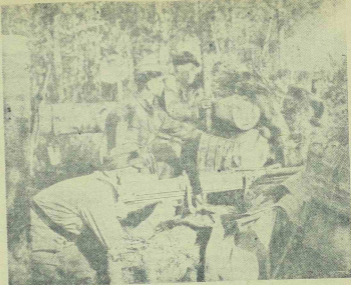
Előretolt finn állás.

... Így szöött az Úr. S a menyeyi fényes- ... mely szűrárdt belőle, bebörtözt a ... szegény maggórnyát, aláztos embert. ... ter, pedig lámpora nyitotta a szűr- ... ország kaput, hogy a csizmadia be- ... chessen a mennyeknek országába.