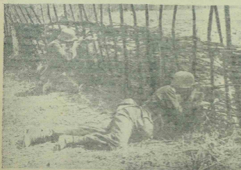
Honvédeink kemény harcban állnak a boszevizmsu ellen.

Alperes: Hogy olyan lyukba volt, hogy úgyis ki kellett volna húznom zatai.