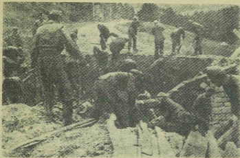
Diadalmasan ábréholád csoportaink előtt ma ezek akadályok, bár a rendetlen, visszavetülő botcsavartakban van még annyi idejük, hogy miadent felgöszönek és felrobosztanak maguk magúit. De nem érnek ekké vele. Mások csoportaink rendlélül gyorsan és ügyesen állítják helyre a megrongált utakat, hogy az időzés fennátadást ne szenvedjen. Képzék, est a gyors és eredményes munkát ábréolja.