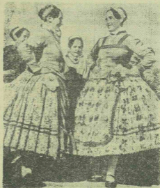
Bácskai magyar lányok.

51-ben történt az eset. Lementünk fürödni. anak nem volt szabad a nyílt vizen fürdés, de jött s egy pokrócon leült a homokos partra. apám beuszott a nádason belül s amint ott lu- jön vele szemközt lassu mozgással egy termel- . Vagy a hullám hányta, vagy a szellő tolt, viz színén jött feléje. Első pillanatra nem is-