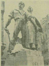
Az elszakított állt területek szobra az országosállat.

Megkezdtek Maros-Torda vármegye székházának építését. Maros-Torda vármegye székházának befejező munkálatait rövidesen megkezdik. Az épület Marosvásárhely legszebb épületei közé fog tartozni.