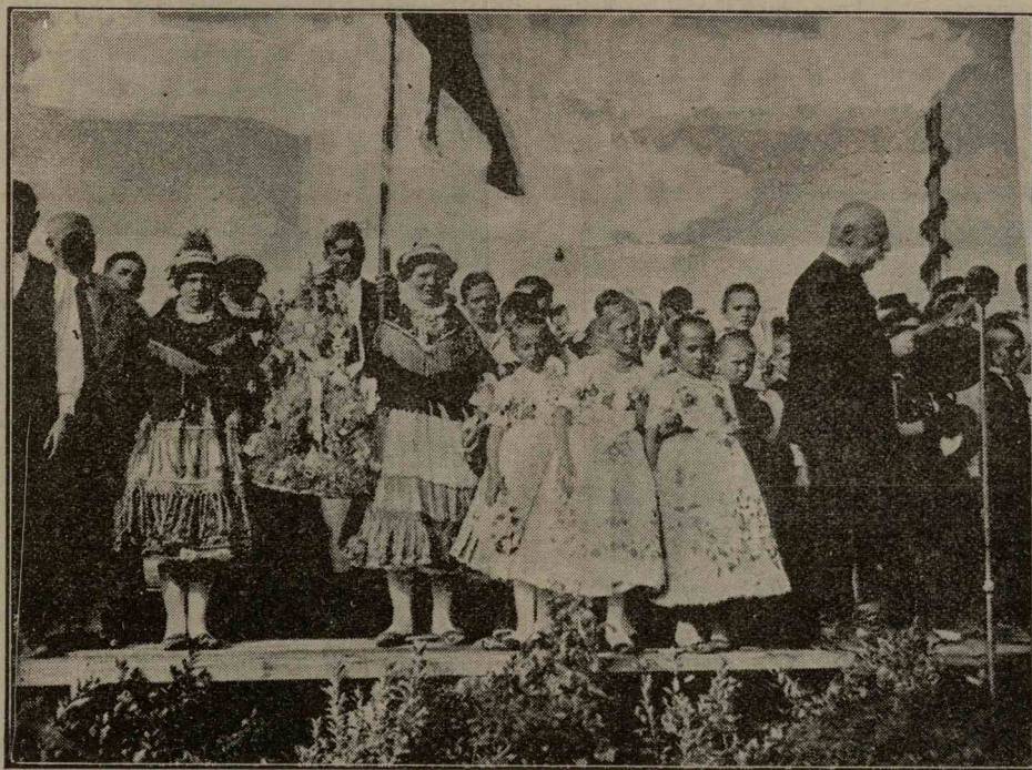
Az új kenyér ünnepe Szegeden.

Ósi szokások szerint az uj kenyér megszegése alkalmával a falvakon, vagy