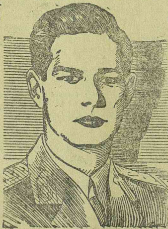
I. MIHAI Románia királyja

— A román nép jövőjébe vetett tökéletes bizalommal lépünk rá, rendületlen elhatározással arra az útra, amely a holnap szabad, hatalmas és boldog Romániájához vezet.