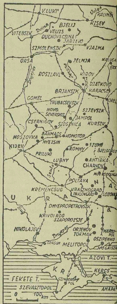
A KELETI ARCVONAL VELIKJE LUKITÓL AZ AZOVI-TENGERIG

Zürich. (Tp.). A Basler Nachrichten című svájci lap londoni tudósítója jelenti: A Daily Worker, az angol