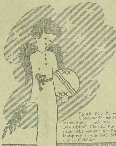
Type 925 X. — Das Klangwunder mit Gegenaktentende. „Inclinator“ Skala. „Multibloc“ Chassis. Kathodenstrahl-Abstimmanzeiger. Konzertlautsprecher Type 9640. Sehr elegantes Gehäuse.

DAS SCHÖNSTE WEINACHTSGESCHENK EIN PHILIPS-RADIO