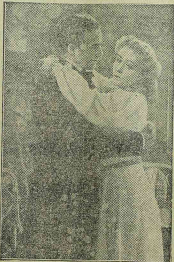
WILLY FRITSCH és FRIEDL CZEPA a Könnyelmű lány című UFA film egyik jelenetében