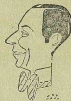
ERICH FIEDLER az UFA filmek kedvelt színésze