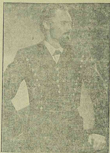
GUSTAV DIESSL a Kaucuk című UFA-filmben