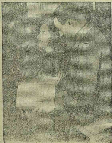
MURATI LILI és THEO LINGEN a Mi történt az éjszaka című filmben