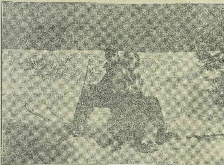
MÉG A LEGKISEBB FAROKON IS VAN HELY Mathia Wieman és Brigitte Horney az Anna Favetti című UFA-film egyik jelenetében

Heinrich George legújabb filmje a Nagy árnyék című Tobis-film, amelyben első ízben játssza egy színész és ezen keresztül saját élete szerepét. Már ez is egyik biztosítéka annak, hogy feladatát még az eddigiekénél is jobban fogja megoldani. Művészkörökben nagy érdeklődéssel várják ezt a filmet, amelynek többi szerepét Heidemarie Hatheyer, Marina von Dittmar és Will Quadflieg alakítja.