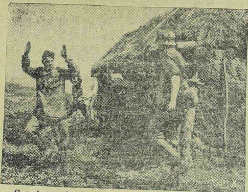
Szovjet orvlövészek kifüstölése rejtékhelyükről.