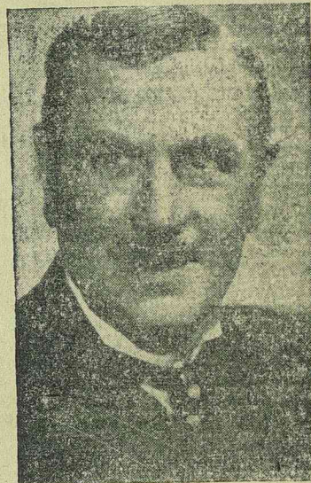
POINTNER ANTON az Annuska című Bavaria-filmben

SCHNEIDER MAGDA Augsburgban született és tanulmányai befejezése után az augsburgi konzervatóriumban énekelni tanult. Mint operaénekesnő azt a feladatot tűzte maga elé, hogy az emberekhez közelálló alakokat személyesítsen meg úgy, ahogyan azok a hétköznapiak során élnek kerülnek. Ezt a célját 1931-ben első nagy filmjében érte el. Azóta egyike a legkedveltebb filmszínésznőknek. A mozika közönsége bizonyára látta már több filmjét, amelyben derűs, vidám megjelenésével, művészi tudásával és 'hangjával' nagy sikert aratott. Legutóbb a „Szerelmi komédia” című Berlin-filmben játszott főszerepet.