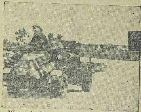
Német páncélcsovi előhaladása a keleti fronton