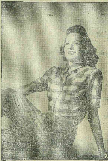
SPORTBLUZ piros-fehér kockás gyapjuszövetből

Ma amikor a kosztüm divatosabb, mint talán bármikor, igen fontos szerepe van — a bluznak. Ez természetes is, mert kosztümjeinket csak úgy lehetjük változtatossá, ha több bluzt viselünk hozzá. A divattervezők és a nők képezelete szinte naponta teremt valami újdonságot a bluzon. Etikintetben a találékony-ság igen sokoldalú.