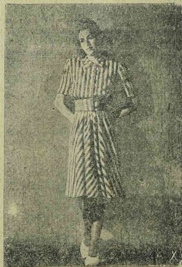
Piros-fehér csikozott sportruhák kabátkáival

Elveszett vasánap a hármasszigeten egy karikagyűrű. Becsületes megtaláló 1000 lei jutalomlan részesül. Kalmár, Arad, Ioan Calvin 9, ajtó 11. (3205)