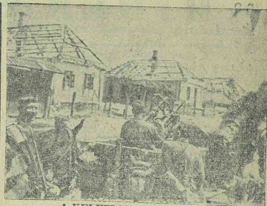
A KELETI FRONT HARCAI