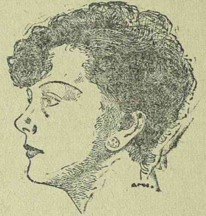
LIL DAGOVER a hercegnő szerepét alakítja a „Kleine Residenz” című pompás filmben.