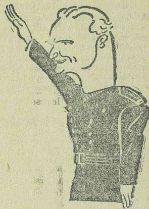
SERRANO SUNER spanyol külügyminiszter

Madridból jelenti a Német Távirati Iroda: Serrano Suner spanyol külügyminiszter és hitvese szerdán este Olaszországba utazott, ahol Ciano gróf olasz kül-