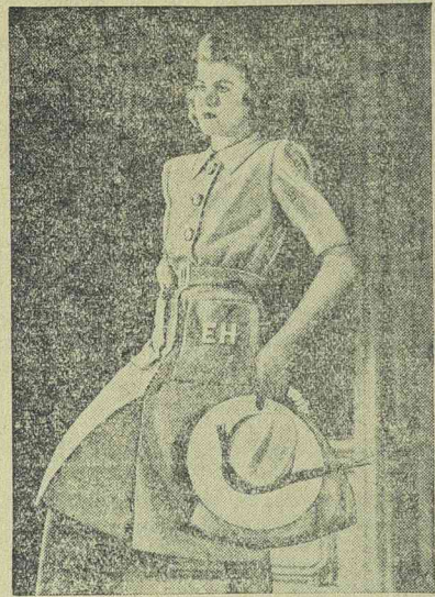
Divatos sportruha nagy reáverott zsebekkel

A Stefani iroda úgy értesül, hogy az Alaszka elleni támadás következtében az Egyesült Államok haditengerészeti minisztériuma parancsot adott a Panama-csatorna övezetének fokozottabb ellenőrzésére. Az ott állomásozó amerikai helyőrségeket megerősítették és riadóállapotba helyezték. Ugyancsak riadóállapotot rendeltek el a kaliforniai partokra is.