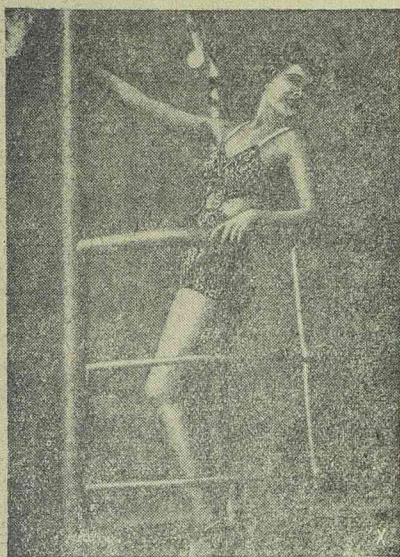
A LEGUJABB STRANDDIVAT

Eredeti fürdőruha két részből. A fürdő nadrág és a felső rész két csattal van összekapcsolva.