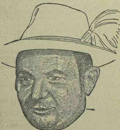
OSKAR SIMA az „Eladott nagypapa” című Bavaria-filmben

A Szovjet elleni hadjárat című nagy PK-filmlet az UFA hozta forgalomba. A Szovjet elleni háború harcaterén készült nagyszabású riportfilm valóban napjaink harcát és küzdelmeit mutatja be és egy rész a ma történelméből. Ma még szólnak a fegyverek és zúgnak a repülőgépek a szovjet-harcateren, de az elmúlt hónapok eredményei és a front mai állása már biztosítékot nyújtanak a végső győzelemben való hitre. A nehezét már leküzdötte a bolsevizmus ellen harcoló Európa együttes hadserege, mert a németek oldalán ott barcol csaknem minden nemzet fia és önkéntese és Európa népei együtt fognak örülni az új Európa megszületésének és békéjének. Gépeztek és embermilliók háboruja ez a gigantikus küzdelem, amely a viaskodás méreteinek megfelelő széles skálában fogja majd örömeit osztogatni és ez az, ami a katonákat fűti és bizakodással tölti el. Az UFA operatőrjei nagy munkát végeztek és a „Szovjet elleni hadjárat” az elmúlt évek egyik legnagyobb szabású riportfilmje.