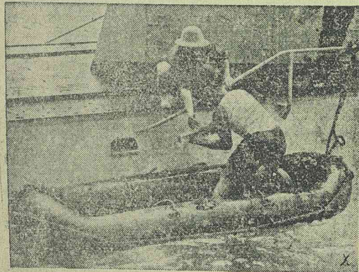
Az egyik német tengeralattjáró a tengeren egészi ki élelmiszerkészletét

A világ leggyorsabb mozdonya. A világ leggyorsabb villamosmozdonya az 1' Do 1'-gyorsvonatmozdony. Az E 19 a Deutsche Reichsbahn-sorozatból: egy 800 lóerősusteljesítmény mellett 225 km. órassebességet ér el. A mozdonynak mindkét vége alatt egy futótengelye és 4, egyenként egy motor által hajtott AEG-fazékrugó-indítással hajtótengelye van. A menetvezeték 15.000 voltos feszültségű (16 2 / 3 Hz), két álló-áramleszedő a mozdony közepén elhelyezett olaj-transzformátorba vezeti és a motorok feszültségére letranszformálja. Mindegyik motor 2000 lóerőt fejt ki. A mozdony szolgálati súlya 114 t. A meghajtókerekek átmérője 1660 m/m. A tervezett legmagasabb sebessége 180 km/ó. A megengedett sebessége 220 km/ó-ra lett megszabva. A nagy menetsebessége miatt az E 19 egy villamosféken kívül még egy rendkívül erősen működő légfékkel is rendelkezik. Az E 19 mozdony egy 8 D. kocsiból álló szerelvényt 360 t súllyal 4,5 percen belül 180 km/órassebességre képes hozni. A legnehezebb német emelkedő-pályát, Probstzella mellett, a thüringiai erdőben (Berlin—München-vonalon) az E 19 mozdony egy 360 t szerelvényvel utánpótlás vagy előfogató nélkül befutotta. Az első elkészült E 19 sorozatu mozdony az 5000. mozdony a berlini AEG-nek, amelyek messzemenő próba- és menetrendszerű utazásoknál nagyvonalú beváltak. Egy mozdony azonos építési és teljesítményű a 4 egyenkénti motorok helyett 4 ikermotorral, tehát 8 motorral lett felszerelve.