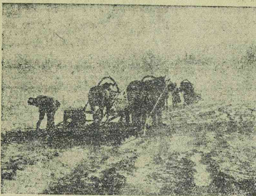
A keleti fronton hóekék teszik szabaddá az utat az utánpótlás számára