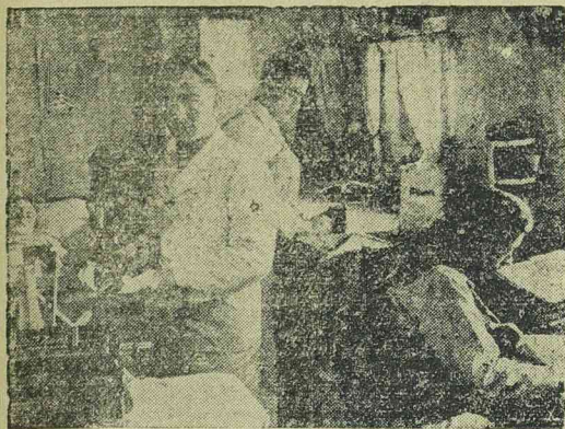
Egy német cirkáló kórházi fülkéje