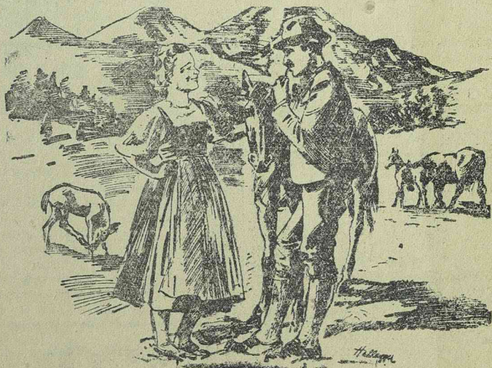
„ANYA ÉS LEÁNYA”

feleségével, és elcsúszva viselkedik vele szemben. Édesanyja emléke féltékenységgel tölti el edesapja második felesége iránt. Akkor azonban váratlan fordulat történik a tizenhét éves leány életében. Borbála egyik fiatal ismerőse kalandvágyóan ostromolja a tizenhét éves leányt, de Borbála elárítja a veszedelmét mostohaanyja felől. A leány és a fiatalember is megígéri, hogy nem találkoznak többet egymással, de egyikük sem tartja be szavát. Borbála a fiatalember lakásán találja mostohaanyját, aki akkor felismeri, hogy Borbála, mint igazi anya védelmezi és megtalálja a hozzá vezető utat. Az asszony megígéri a leánynak, hogy nem szól semmit edesapjának, aki gyanusnak találja, hogy felesége a fiatalember lakásán járt. Tragédia fenyeget, de még idejében megtudja a valóságot. Ez a rövid tartalma a filmnek, amelynek egyes szereplői a legnagyobb művészettel bonyolítják az érdekes cselekményt.