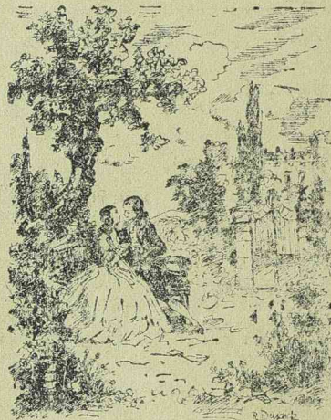
„EGY ÉJSZAKA MELODIAJA” című Tobis-film egyik jelenete

Ugy tudják, hogy Willy Fritsch felesége inkább a cigarettafüst mellett döntött.