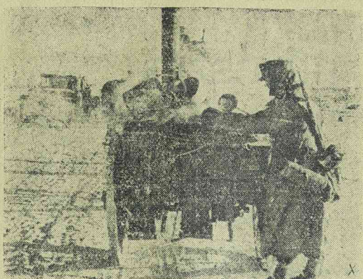
Tábori konyha a keleti front havas útján