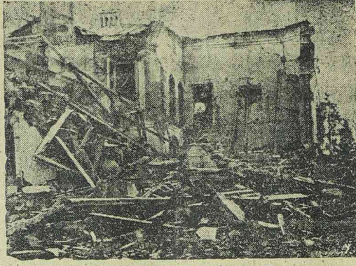
Timocsenko szovjet marsall szétlőtt főhadiszállását