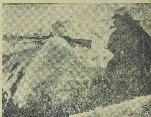
Német katona őrészen Szentpétervár előtt