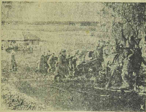
A német utánpótlás fáradhatatlanul követi a harcoló csapatokat