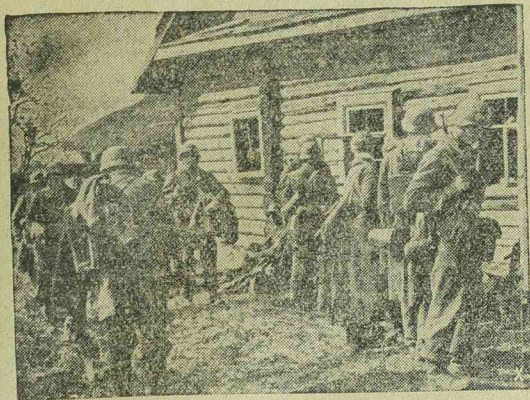
Német csapatok pihenője a keleti fronton