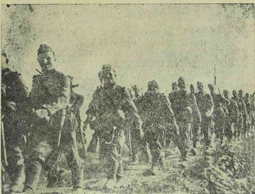
Menetelő német gyalogság a keleti fronton