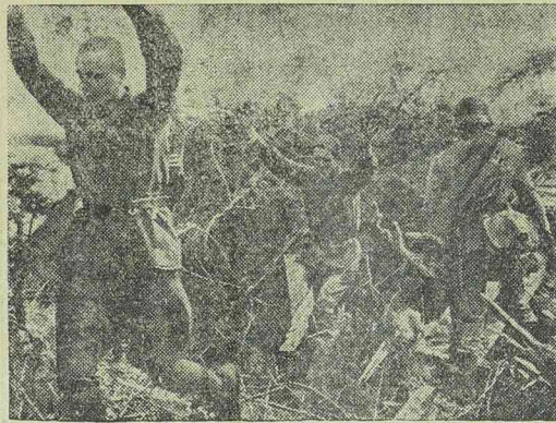
Német utászok foglyul ejtik egy bolsevista erődítés védőit