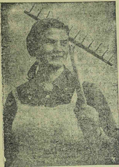
Német főiskolai hallgató női munkaszolgálatban