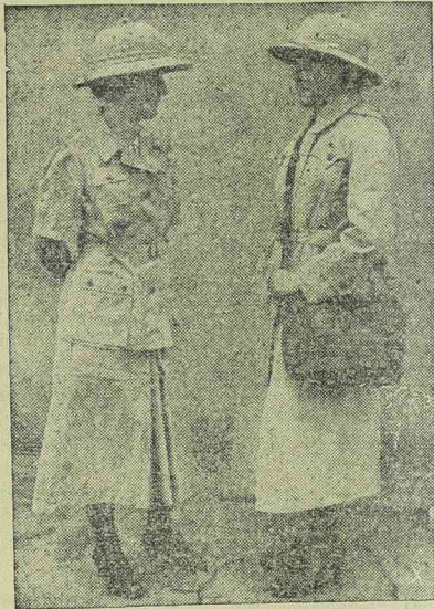
Német vöröskeresztes ápolónővérek Északafrikában