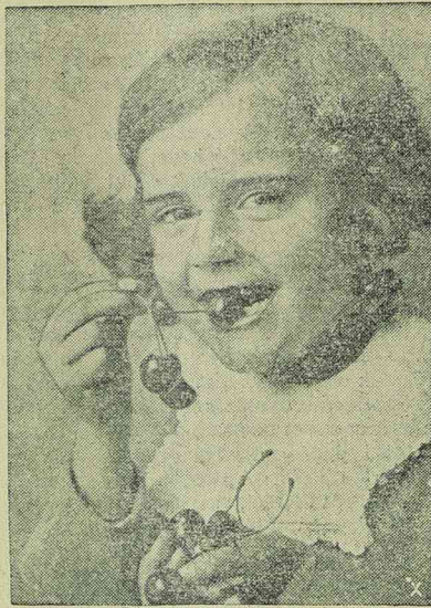
Késői cseresznye — de jó