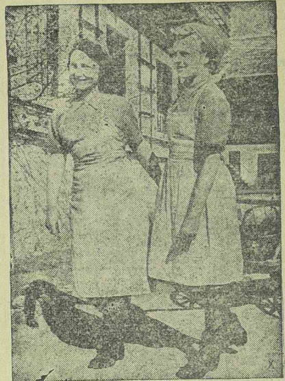
Veicht Lydia, a híres korcsolyabajnoknő és munkaszolgálatos