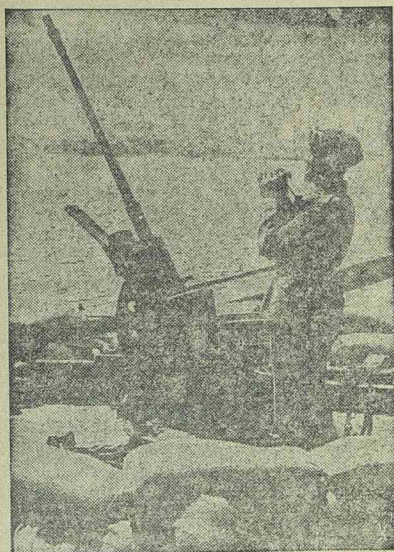
Résen áll a német légvédelem.