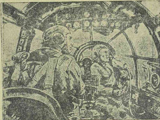
Légi csatában résztvevő német haditüdősítő rajzokat készít a harc jelenetéről.