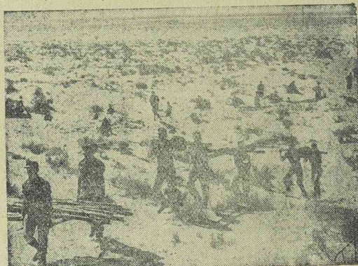
A német és olasz katonák előkészítik állásaikat a libiai sivatagban