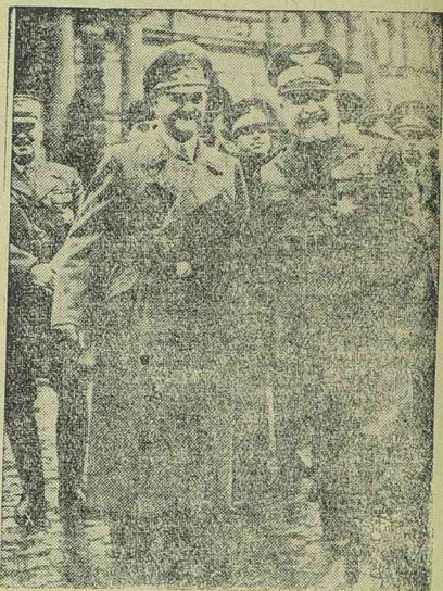
Teruzzi olasz gyarmatügyi miniszter Németországban

Európa keleti és északkeleti országai, Szovjet-Oroszország a Balti-államokkal, Finnország és az egykori Lengyelország területe nagy kender- és lenfölségekkel rendelkezik és szinte mérhetetlen cellulozkészleteket szállíthat a mügyapot- és műselyemiparnak. A len és kender világtermelésében Európa szárazföldi része 80 százalékkal vezet. Belgiumot is hozzászámítva, a felsorolt országokhoz, két és félmillió hektáron terem len és több, mint egymillió hektáron kender. Szovjet-Oroszország azonkívül tekintélyes mennyiségű gyapjút és gyapot szállítására is képes. 1936—37-ben az oroszországi és dél-európai gyapottermés már közel járt az egymillió tonnához, ami a világtermelésnek 15 százaléka. Ami a gyapút illeti, Európában a juhok száma meghaladja a 170 milliót és ez hozzávetőleg a világ juhállományának egynegyede. Igaz, hogy Európa ennél jóval többet fogyaszt, de idővel pótolni lehet a hiányt a mügyapotipar és a kazein-feldolgozás fejlesztésével.