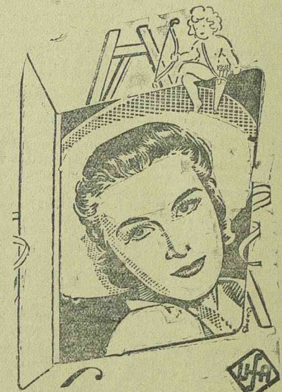
A főszerepekben: ILSE WERNER és JOHANN RIEMANN