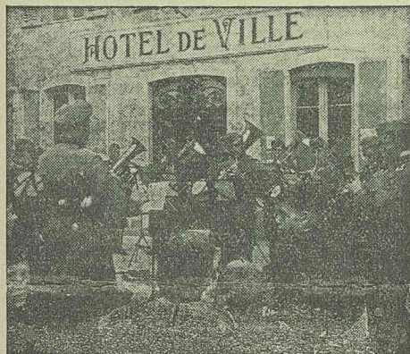
Német katonazenekar ténzeréje Bourges francia város főterén.