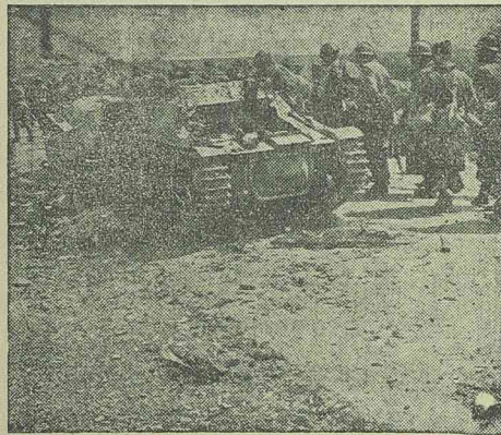
Francia hadifoglyok elhaladnak egy szétlőtt tank mellett.