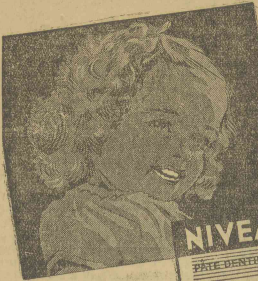
Kis és nagy tubusban kapható

Valószínű, hogy a higgadt és kockázatot gondosan elkerülő angol számítás már kitermelte Churchill ellenzékét. Ez a tudat valahogy hűvösen beárnyékolta a keddi, alsóházi beszéd szokott tüzeségét. Churchillnak az angol politika tragikus szerepe jutott ki: későn jött és talán tovább maradt, mint azt Nagybritannia érdekei megkívánják.