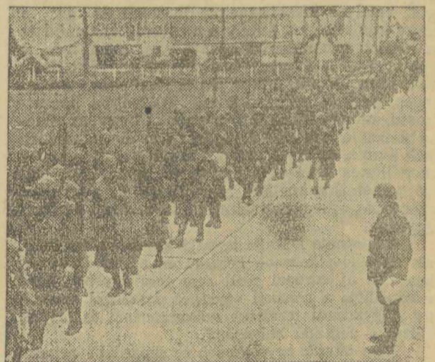
Francia hadifoglyok hosszú sorokban vonulnak a front mögötti táborba.