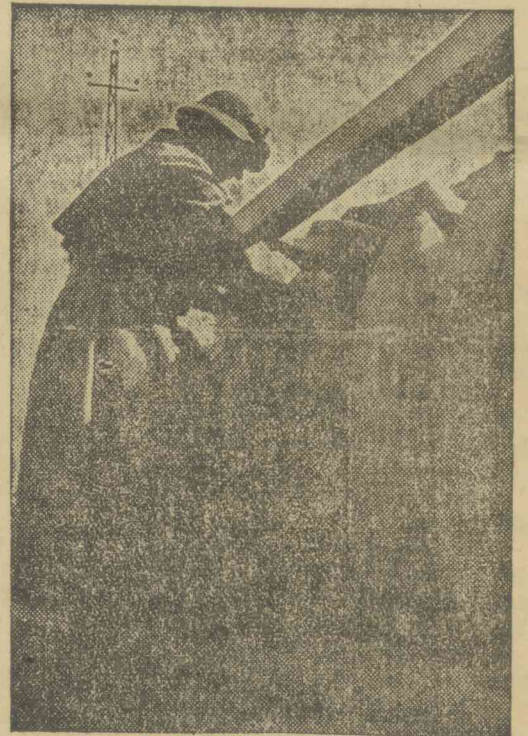
Hatalmas, 28 centiméteres gránátok, melyek az angolok menekülése után a németek kezére kerültek a nyugati harctéren.

— Fémtermékek helyettesítése. A nemzetvédelmi minisztériumban Gr. Romascanu műszaki főtanácsos megbeszélést folytatott a szappangyárosokkal a hadsereg és a lakosság szappanellátása tárgyában. Egy másik értekezleten Gr. Romascanu egyes fémgyártmányoknak más anyagokkal, mint kaucsukkal, bakkelittel és celluloiddal való helyettesítéséről tárgyalt.