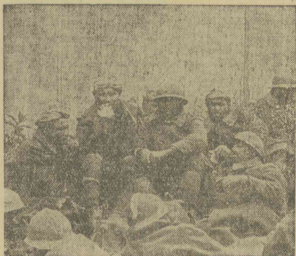
Gyarmati fekete katonák, akik a nyugati harc-téren a németek fogságába estek.