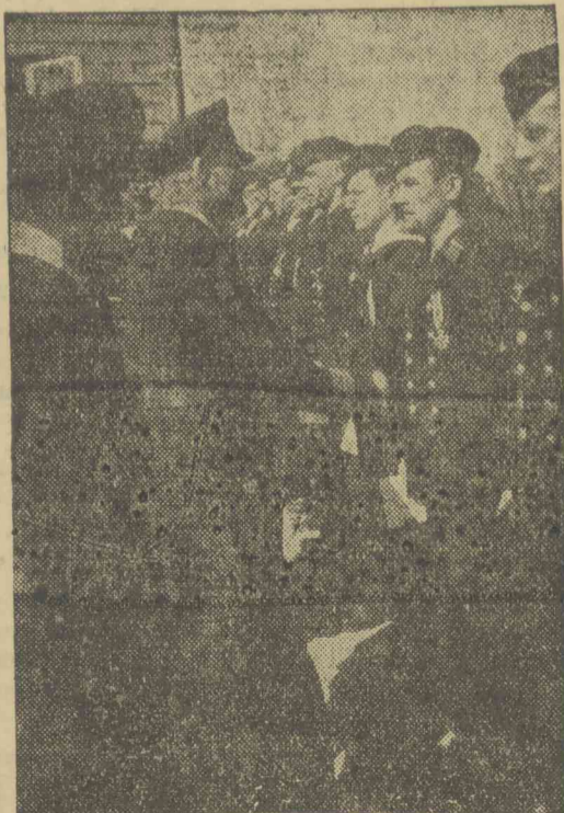
Egy német cirkáló személyzetét eredményes harcokért a vaskereszttel tüntetik ki.

(=) Állatexportőrök figyelmébe. A temesvári Kereskedelmi és Iparkamara felhívja az érdekelt állatexportőrök figyelmét arra, hogy akiknek vasárnap is van külföldre szóló állatszallítmányuk, lépjenek érintkezésbe a kamara titkári hivatalával, mivel a kamara a jövőben vasárnap is kiállítja a szükséges származási bizonyítványt. Az exportőrök érdekében áll ugyanis, hogy a beviteli ország határánál a szállítmány továbbítása ne szenvedjen késedelmet és a gyors elvámolást a kamara úgy kívánja előmozdítani, hogy azon cégeknek, amelyeknek vasárnap is van állatexportjuk, a szükséges származási bizonyítványt haladéktalanul kiállítja.