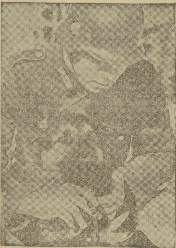
Kutyák a háborúban hűséges segítőitársai a német egészségügyi csapatnak.