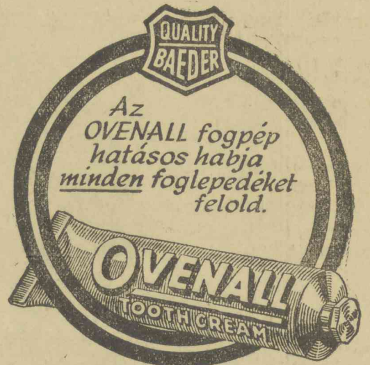
A HABZÓ FOGPÉP