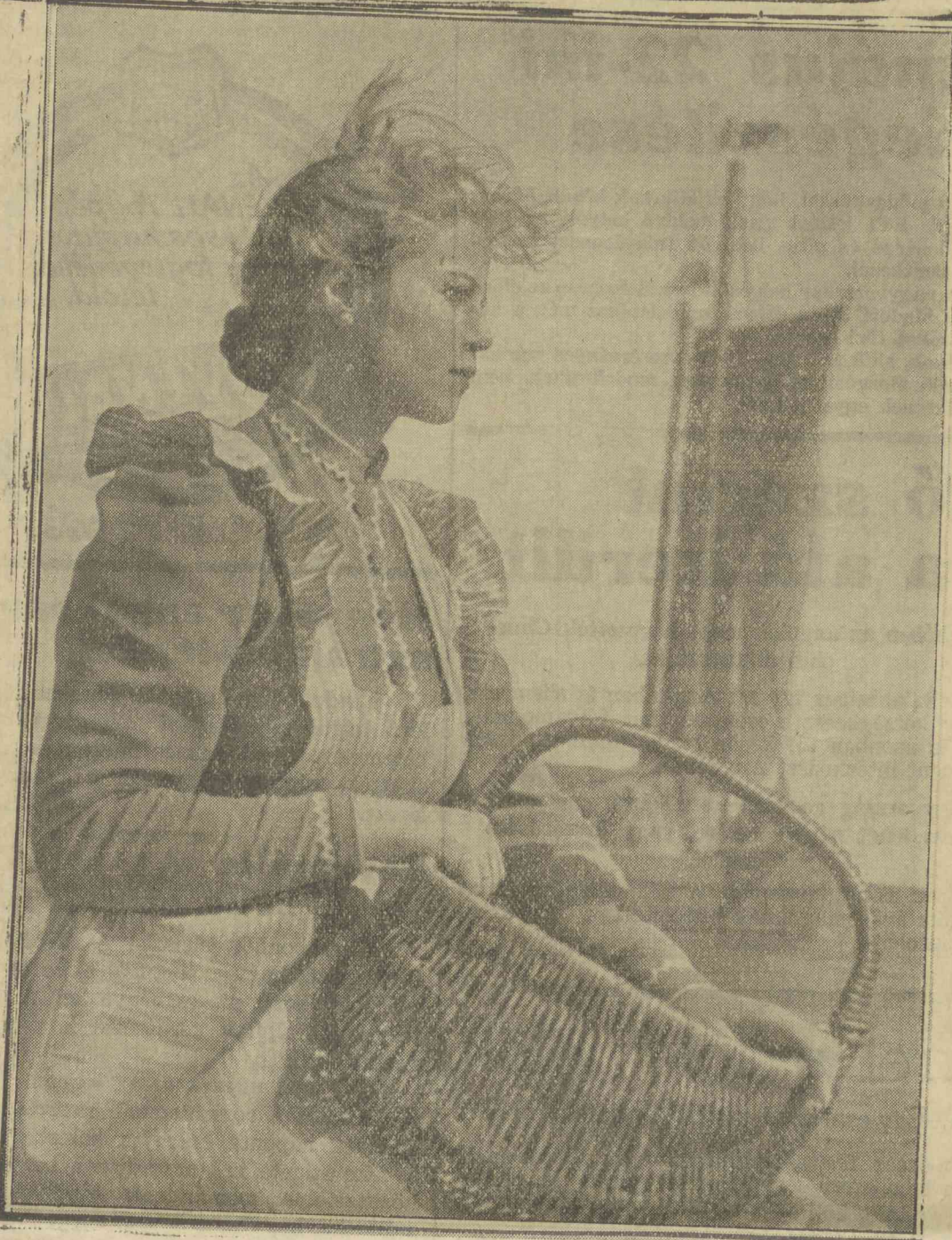
Kristina Söderbaum az Utazás Tilsitbe című filmben, mely ma kerül bemutatásra a Capitol moziban