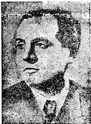
Dr. Stanciu Stoian, Ministrul Cultelor.

La institutele teologice pot fi înscriși: absolvenții liceelor, ai școlilor normale (pedagogice) și ai fostelor seminarii teologice.