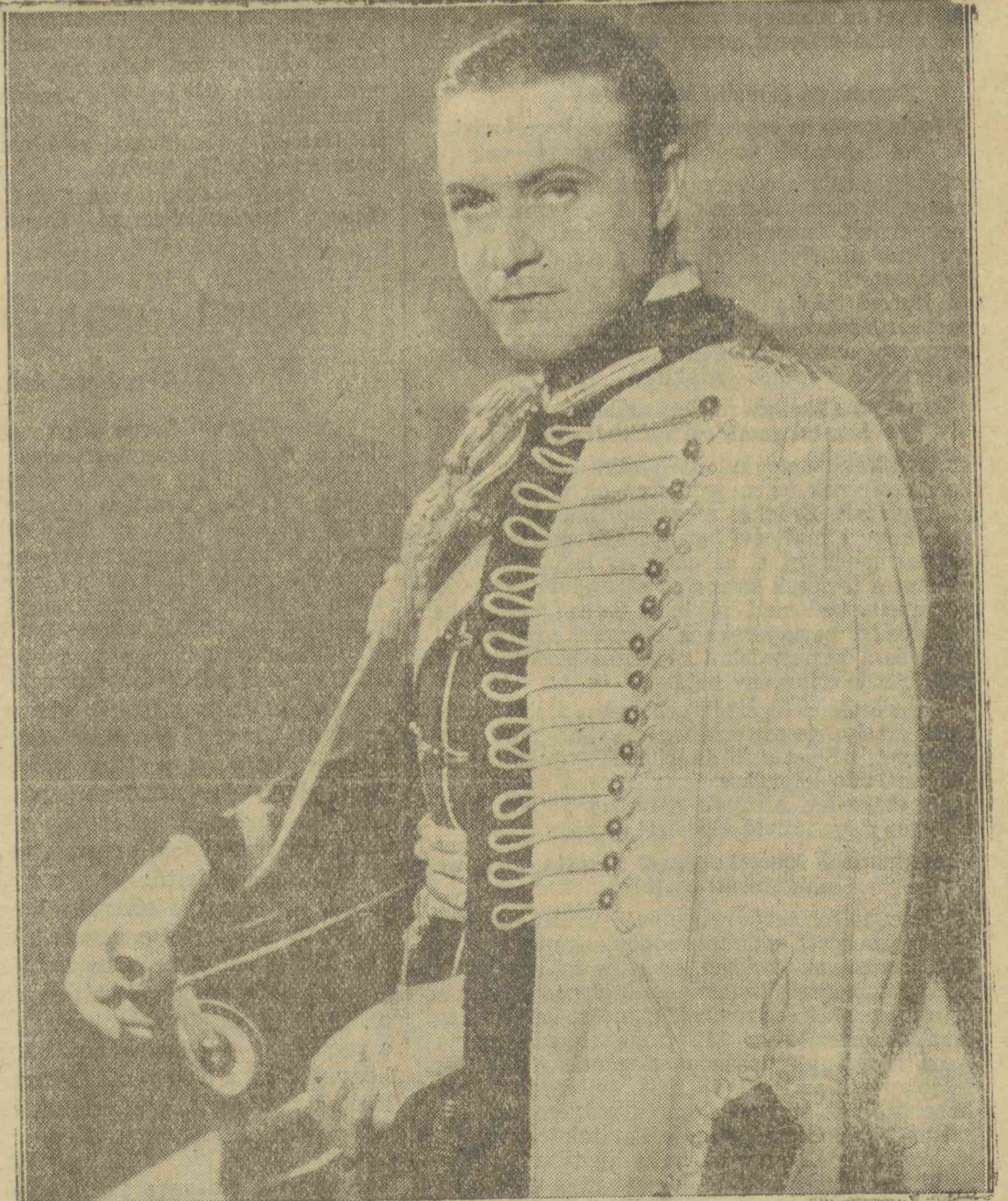
Az asszonyok jobb diplomaták című új UFA film, Karstein kapitány szerepében