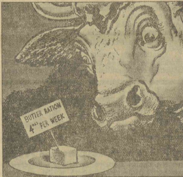
A „Daily Mirror”-ból: „Csak ennyi az egész, élelmezési miniszter úr?”