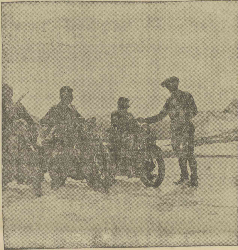
Motorkerékpáros katonai őrszolgálat Európa legmagasabb útján

A pénzügyi gárda ezeknek az utasításoknak a megjelenésétől számítandó 30 napon belül kérdőíveket állítat ki a pékekkel termelő képességről és a fogyasztott bélyegmennyiségről. A kitöltött kérdőívek egyik példányát az adóhivatal, a másikat a gabonaértékesítő központ kapja.