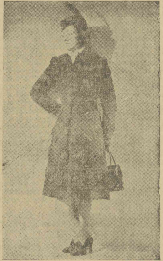
Fekete gyapjúkabát asztrakán csíkokkal